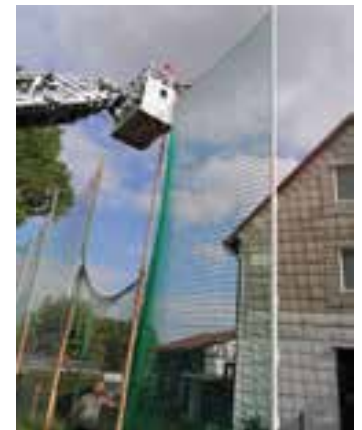
Der Vorstand des SV Einheit 90 Wolkrämshausen e.V.

Im Rahmen ihrer jährlichen Kontrolle der Drehleiter schlug die freiwillige Feuerwehr Wolkrämshausen gleich zwei Fliegen mit einer Klappe. Nicht nur die Funktionstüchtigkeit wurde festgestellt. Im Rahmen der Überprüfung halfen die Feuerwehrleute den Sportfreunden auch die letzten zwei Fangnetze am Sportplatz zu befestigen. Während die anderen Netze im April neu gespannt werden konnten, mussten die letzten komplett ausgetauscht werden. Für die Unterstützung dabei bedanken wir uns herzlich bei den Kameraden.