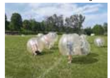
Die Schüler*innen und alle Pädagog*innen der Grundschule „Am Lohholz“

unvergesslichen Erlebnis für alle Beteiligten beigetragen haben. Vielen Dank an den Förderverein der Grundschule „Am Lohholz“ für die finanzielle Unterstützung.