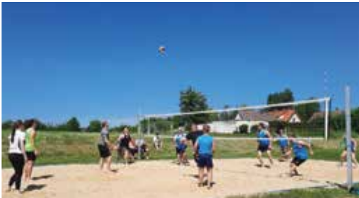
Spiel Hainrode gegen Sülzhayn