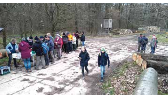
Verpflegungspunkt am Fronderöder Wald