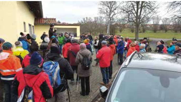
Begrüßung der Wanderfreunde auf dem Kehmstedter Sportplatz

Am Sonntag den 02.02.2020 richtete der Sportverein TSG „Glück-Auf“ Kehmstedt seine alljährliche Winterwanderung aus. Bei wechselhaftem Wetter fanden sich etwa 100 Wanderfreunde aus nah und fern ein, um die Wanderstrecken von 5 bis 10 km unter die Füße zu nehmen. Die Route führte über Fronderode und Königsthal wieder zum Ausgangspunkt der Wanderung auf den Sportplatz nach Kehmstedt. Am Verpflegungspunkt im Fronderöder Wald und am Ende der Wanderung konnten sich