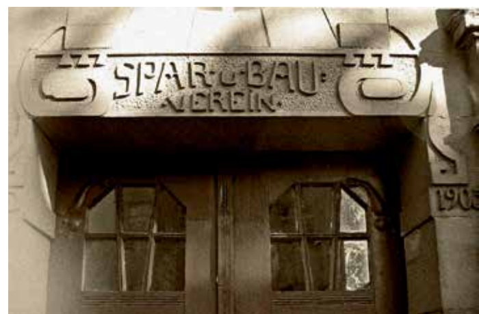
Eingangportal Hesseröder Straße 29