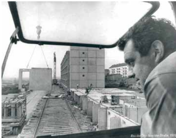
Am Frauenberg 1970

Die Wohnungsbaugenossenschaft eG Nordhausen wurde am 12. Juli 1991 beim Kreisgericht Erfurt un-