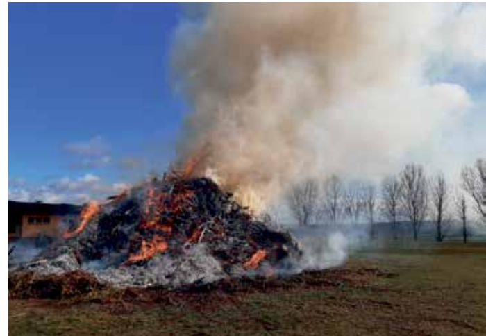
Anglüh - Osterfeuer Wernrode 27.03.2021