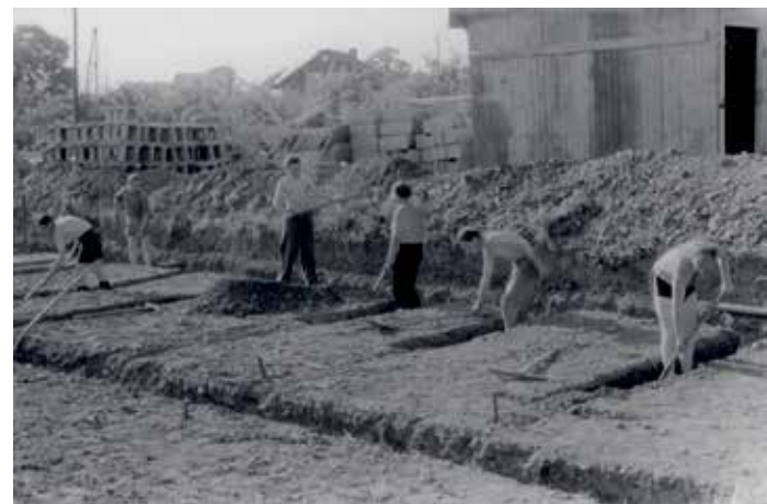
Mitglieder helfen beim Wohnungsbau

Auch wenn das “Miteinander Feiern” derzeit nicht stattfindet, soll das “Miteinander Zuhause” auch im Jubiläumsjahr weiterhin ganz im Interesse der Genossenschaftsmitglieder gestaltet werden. Daher findet aktuell wieder eine Befragung aller WBG-Mitglieder nach ihrer Meinung zum Thema “Wohnen bei der WBG Südharz” statt. Vorstand und Mitarbeiter der Genossenschaft ziehen aus diesen Informationen wichtige Schlüsse für zukünftige Entwicklungen. Also: Mitmachen kann was bewegen!