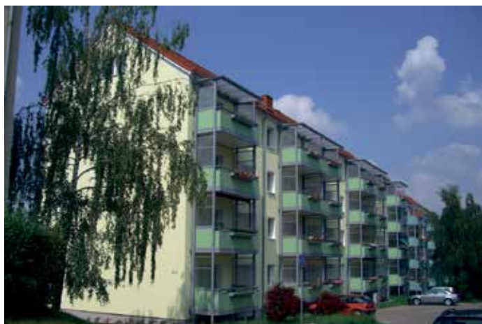
Gartenstraße 20 – 25 in Bleicherode

ter der Nummer 88 in das Genossenschaftsregister eingetragen. Die WBG ist damit das historische Ergebnis aus den Verschmelzungen von zehn Einzelgenossenschaften.