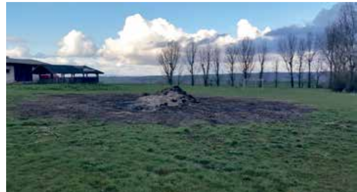
Osterfeuerplatz Wernrode 14.04.2021