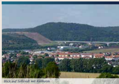
Blick auf Sollstedt mit Kalihalde

gab es Untersuchungen zur Veränderung der Salzbelastung der Sülze. Danach sind die Chloridgehalte der Sülzequelle von 1965 bis 1989 kontinuierlich angestiegen. Neuere Untersuchungen belegen, dass aus der Rückstandshalde Sollstedt herausgelöste Salze im Abstrom über die teilweise verkarsteten Gesteinsschichten des Oberen Buntsandsteins (Röt) bis in den Mittleren Buntsandstein infiltriert werden und im Quellgebiet der Sülze wieder ins Oberflächengewässer gelangen. Durch Überdeckung und Begrünung der Halde lässt sich diese Belastung reduzieren.