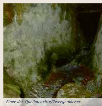
Einer der Quellaustritte/Zwergenlöcher

within the framework of the potash mining waste piles monitoring programme. This showed that the chloride content of Suelze Spring continuously increased between 1965 and 1989. More recent investigations have shown that salts leached from the Sollstedt Mine waste pile have infiltrated and flowed downward through the partially karstified layers of stone, reaching the surface again in the area of Suelze Spring. The covering and re-vegetating of the waste pile has significantly decreased this contamination.