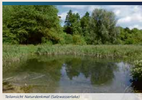
Teilansicht Naturdenkmal (Salzwasserlake)

The branched headwaters of the Suelze are located in a small forest. Due to the numerous springs, the area is also called "Dwarves Holes". The Suelze flows into the Wipper ca. 800 m from here. In the past, the brook drove the waterwheel of the Suelze Mill. Suelze comes from the Old High German „sulza“, meaning „saltwater“. This suggests that the springwaters contain salt. The reason for this is natural leaching of stone strata containing salts. Within the spring area, changes in the Suelze's salinity have been investigated