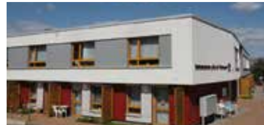
Seniorenheim „Glück auf“

Tagsüber liebevoll umsorgt, abends wieder in den eigenen vier Wänden!