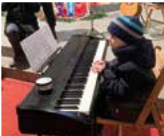
Ole aus Kleinbodungen

• Am 1. Advent feierten wir in der St. Marien-Kirche Familienkirche mit Taufe. Anschließend wurde zum Kirchenkaffee mit Bastelanbot eingeladen.