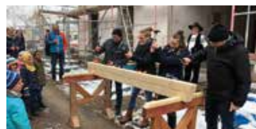
Tagespflegeneubau in Bleicherode