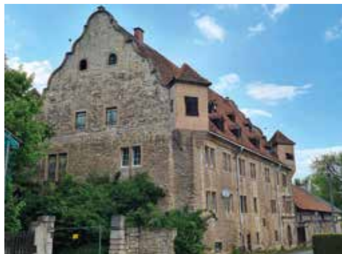
Das Renaissance Schloss in Wernrode