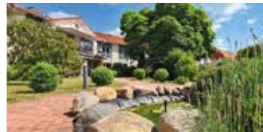
Seniorenheim „Haus Harztor“

Wir beraten Sie gern und unverbindlich. Telefon 036338 45090