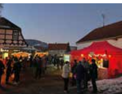
Am 17. Dezember war es endlich wieder soweit, die Vereine von

Obergebra konnten zum Weihnachtsmarkt an der Feuerwehr einladen.