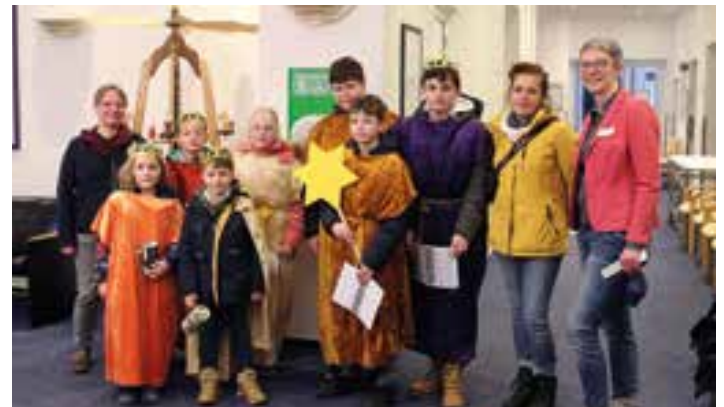
Sternsinger 2023 in Helios Klinik