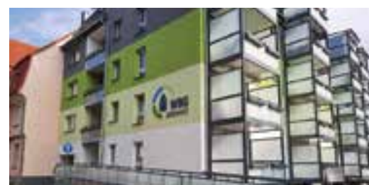
Begegnungsstätte „Am Löwentor“