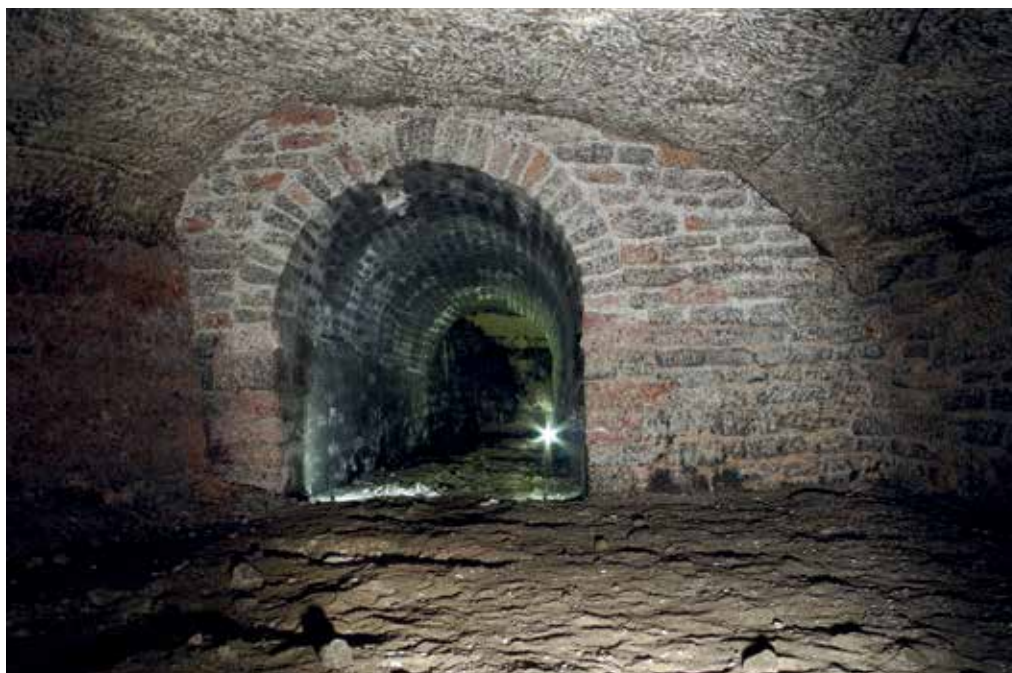
Mauerwerksausbau ohne erkennbare Schäden nach einer Standzeit von nahezu 80 Jahren in einer ehemaligen Abbaukammer im Carnallitit.