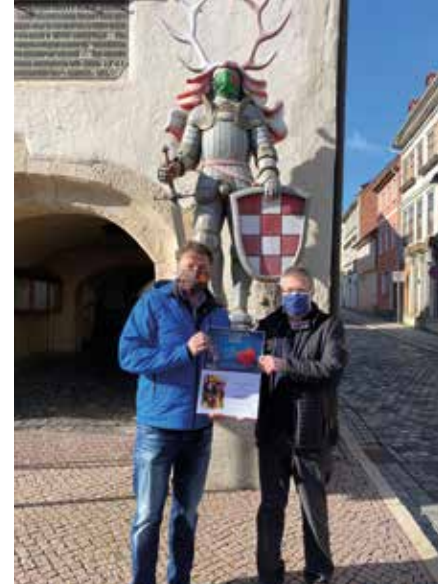
Kampagne #Maskeauf #Bleicherode-zeitHerz

platzes in Wollersleben etc.. Die laufenden Baumaßnahmen wie beispielsweise in Bleicherode die Brückenstraße, die Max-Planck-Straße, in Wollersleben die Dorfstraße werden selbstverständlich in 2021 fertiggestellt. Die Landgemeinde Stadt Bleicherode war zudem sehr erfolgreich beim Einwerben von Fördermitteln im laufenden Jahr und für zukünftige Jahre. Projekte, wie die Sanierung kommunalen Sportstätten, der mögliche Bau des Park- und Caravan-Stellplatzes am Heerweg, die Sanierung des Kulturhauses, die Umbaumaßnahmen in den Kindertagesstätten „Kleine Wipperspatzen“ in Wipperdorf und des „Zwergenstübchens“ in Nohra und die Neugestaltung des Außengeländes in der Kindertagesstätte „Kleine Bodestrolche“ in Kleinbodungen oder die technische Ertüchtigung im Freibad Nohra konnten bzw. können damit weiter vorgebracht werden.