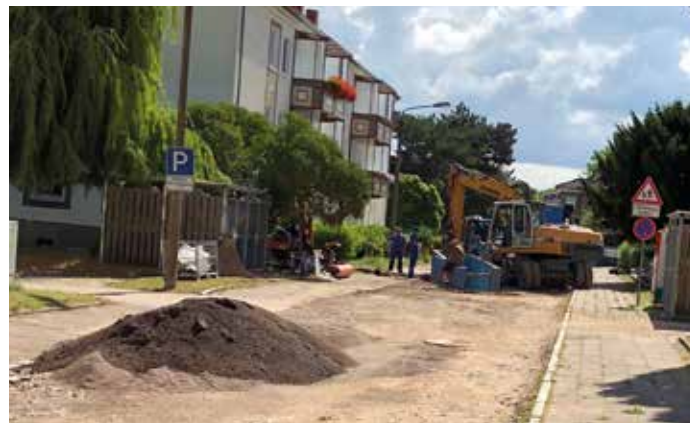
Straßenbaumaßnahme Max-Planck-Straße, Bleicherode

schlossene oder weiter vorangebrachte Projekte und Baumaßnahmen in der Landgemeinde und die strategischen Pläne zeugen davon, dass hier kein Stillstand entstanden ist, wofür ich besonders dem Stadtrat für sein Mitwirken unter erschwerten Bedingungen herzlich danken möchte. Geplante Baumaßnahmen für 2021 sind beispielsweise die Sanierung der Johannes-Kleinspehn-Straße sowie die Sanierung des Verwaltungsgebäudes Haus III in der Hauptstraße in Bleicherode, in Etzelsrode die Sanierung der Buswendeschleife, in Mörbach die Umzäunung des Feuerlöschteiches, der Bau des Spiel-