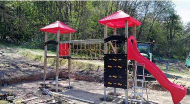
Bauphase Spielplatz - Kletterturm