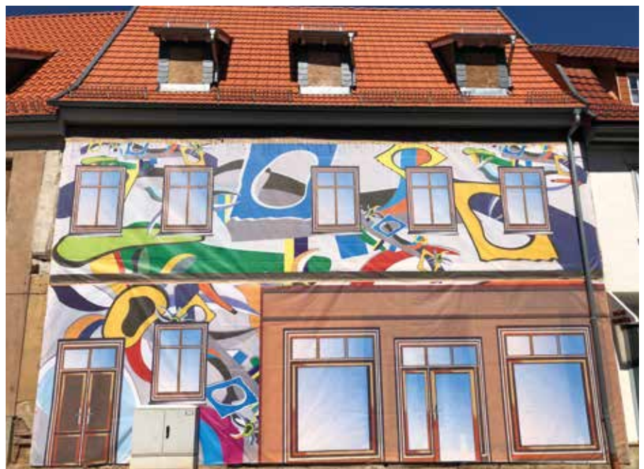
Fassadenverkleidung Haus III

rädchen und Kameraden zu 52 Brand- und 76 Hilfeleistungseinsätzen (Stand 30.11.2020) aus. Beispielhaft genannt sei die Alarmierung am 07. September 2020 zum Gebäudebrand in der Niedergebraer Straße in Bleicherode. Beim Eintreffen des ersten Löschfahrzeuges brannte der Dachstuhl des ehemaligen Möbelwerkes vollständig. Das Feuer war um 11.05 Uhr unter Kontrolle. Um 13.24 Uhr konnte der Einsatzleiter „Feuer aus“ melden. Im Einsatz waren die Feuerwehren Bleicherode, Obergebra, Wolframshausen, Niedergebra und Sollstedt, der Kreisbrandinspektor, der Rettungsdienst, die Betreuungsgruppe des Sanitäts- und Betreuungszuges des Landkreises sowie die Polizei. Die Löscharbeiten wurden von Mitarbeitern des Wasserverbandes Nordhausen und der TEAG Thüringer Energie unterstützt. An der Sicherung des Gebäudes und an Aufräumarbeiten waren