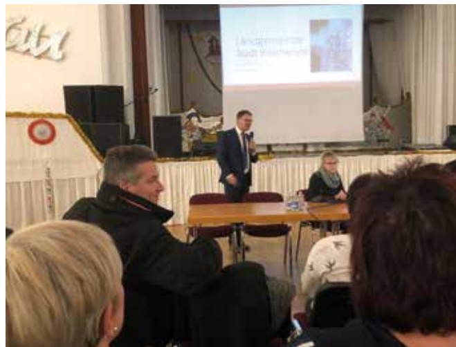
Einwohnerversammlung Feb. 2020

Mitarbeiter des Bauordnungsamtes des Landratsamtes und des Bauhofes der Stadt Bleicherode beteiligt. Sicherungsmaßnahmen im Verkehrsraum übernahm die Verkehrstechnik Klein KG aus Nordhausen.