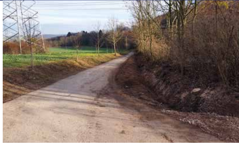
Grabensanierung Zufahrt Tauber