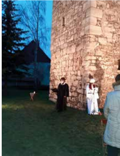
Unser HERZLICHES DANKESCHÖN geht an die vielen fleißigen Helfer.

Nach Verkündung des Weihnachtssegens durften alle Besucher das Friedenslicht aus Bethlehem mit nach Hause nehmen. Trotz vieler Auflagen war es für ALLE eine gelungene Einstimmung auf eine gesegnete Weihnacht.