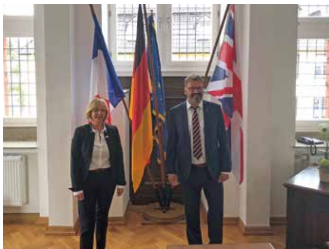
Besuch in Bad Münstereifel am 25.08.2020 (Treffen Dt. Fachwerkstraße)