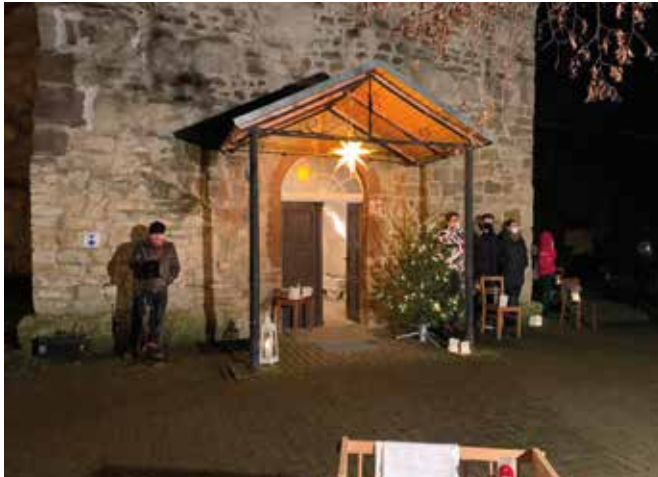
Heiligabendimpression aus Kehmstedt