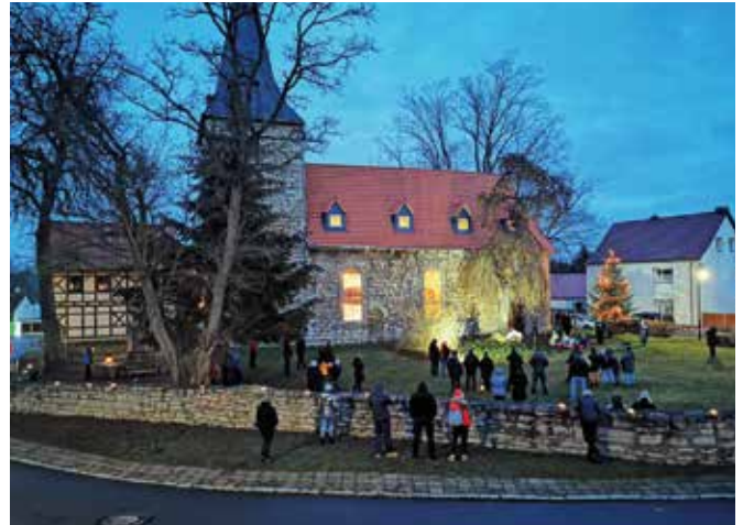
Heiligabendimpression aus Nohra

Seit fast einem Jahr wird die Welt von einem kleinen Virus in Schach gehalten. Vieles ist nicht mehr so, wie es war. Auch die Kirchengemeinden müssen andere, neue Wege gehen. Initiativen, Kreativität sind gefragt, Hygienekonzepte müssen erstellt werden und vieles mehr. Versammlungen und Gottesdienste waren