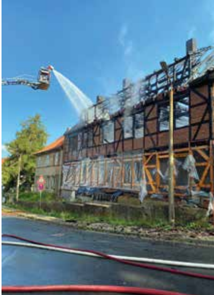
Gebäudebrand Niedergebraer Straße, Bleicherode