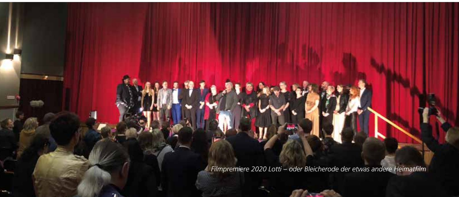
Film Premiere 2020 Lotti – oder Bleicherode der etwas andere Heimatfilm

Anfang des Jahres erhielten die Verwaltungsmitarbeiter in Bleicherode, Wolkramshausen sowie der Bauhof in der