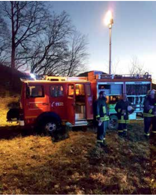
Sichtlich überrascht waren die Kameraden der Feuerwehr als sich am frühen Montagabend, dem 25.02.2019, dichte

te Rauchschwaden über dem „Spatenholz“ bildeten und sich das vermeintliche Lagerfeuer als handfester Waldbrand darstellte. Nach der Meldung an die Rettungsleitstelle wurden die Freiwilligen Feuerwehren Friedrichslohra-Großwenden sowie Kleinwenden-Münchenlohra alarmiert. Die Lageerkundung ergab, dass zusätzlich wasserführende Feuerwehrfahrzeuge an die Einsatzstelle beordert werden mussten. Die Freiwilligen Feuerwehren aus Sollstedt, Niedergebra, Bleicherode, Wolframshausen und Wernrode eilten mit ihrer entsprechenden Technik zu Hilfe. Aufgrund der Ausdehnung des Brandes wurden 2 Einsatzabschnitte gebildet und das Feuer aus östlicher und westlicher Richtung in die Zange genommen. Insgesamt waren 73 Kameraden mit 17 Fahrzeugen vor Ort. Zusätzliches Löschwasser musste im Weiteren im Pendelverkehr vom Kindergarten in Friedrichslohra zugeführt werden. Eine