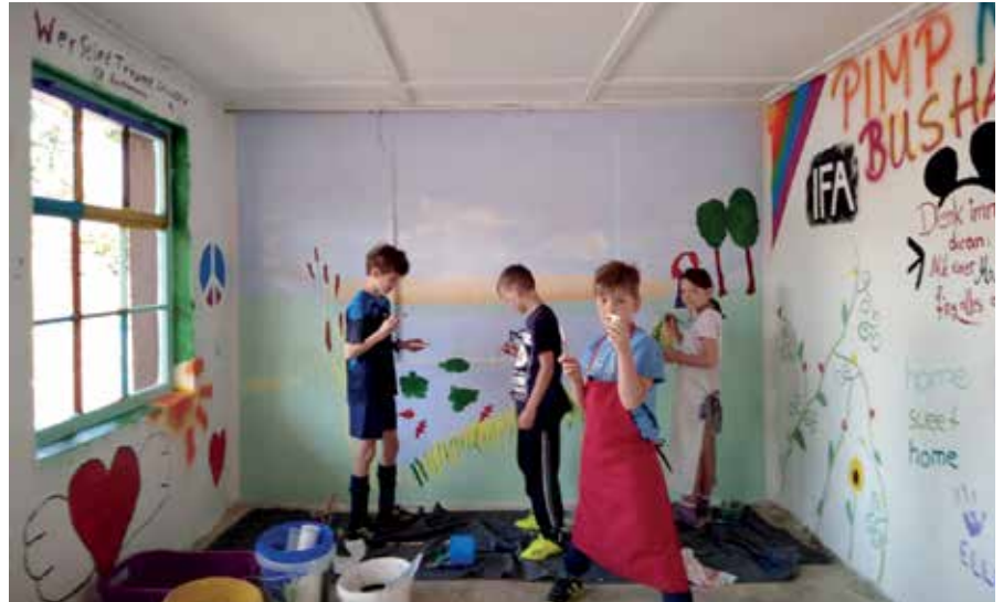
Eine Wand wurde durch jüngere Kinder von Hainrode und Freunde bemalt, es ist das „Molchdorf Hainrode“ dargestellt – in diesem Sommer wurde zum 1. Mal die Molchhütte im Hainröder Teichtal eröffnet und mit Erfolg betrieben. Auch die Decke wurde vom HMV gemalt.

Als erstes wurden Putzschäden beseitigt, dies unter Mitwirkung des Bauhofes Bleicherode, und im Anschluss daran wurde durch den HMV ein Voranstrich vorgenommen. Nun konnten die Innenwände