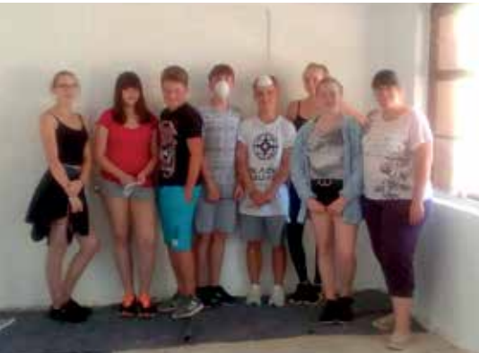
Ältere Kinder der Regelschule Hainleite ließen ihren Ideen freien Lauf.