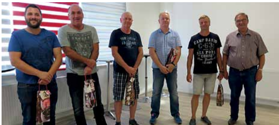
Verabschiedung der Gemeinderäte