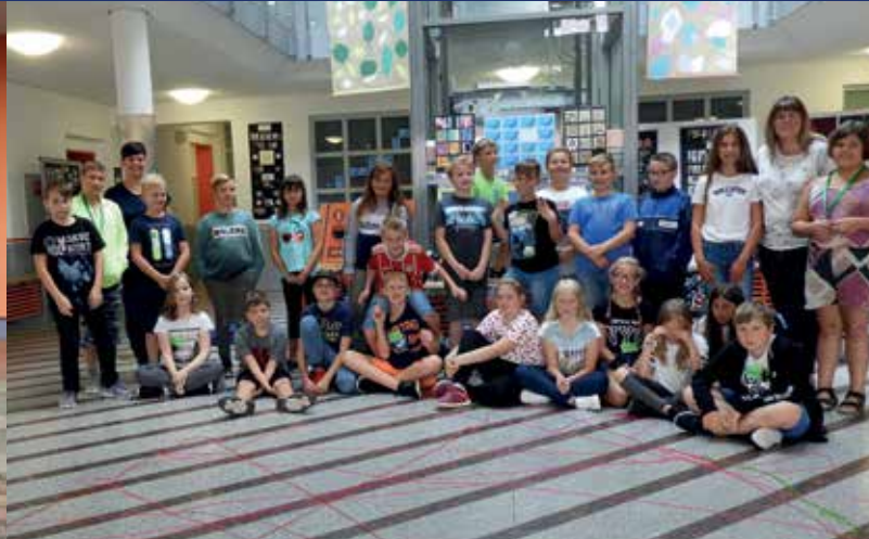
Klasse 5 b

Zum 1. Nordhäuser Stadtparkfest lud die Stadt Nordhausen am 24.08.2019 ein. Auch die Frohe Zukunft Nordhausen gGmbH/Schulsozialarbeit war an diesem Tag im Stadtpark vertreten. Unsere Station „Spieltonnen“ lud Klein und Groß zum Spielen ein und beinhaltete zahlreiche Spiele aus der Schulsozialarbeit. An dieser Stelle ein herzliches Dankeschön an meine vier eifrig engagierten Schülerinnen, die die einzelnen Spiele angeleitet, betreut und koordiniert haben.