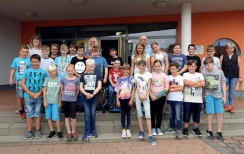
Klasse 5 a