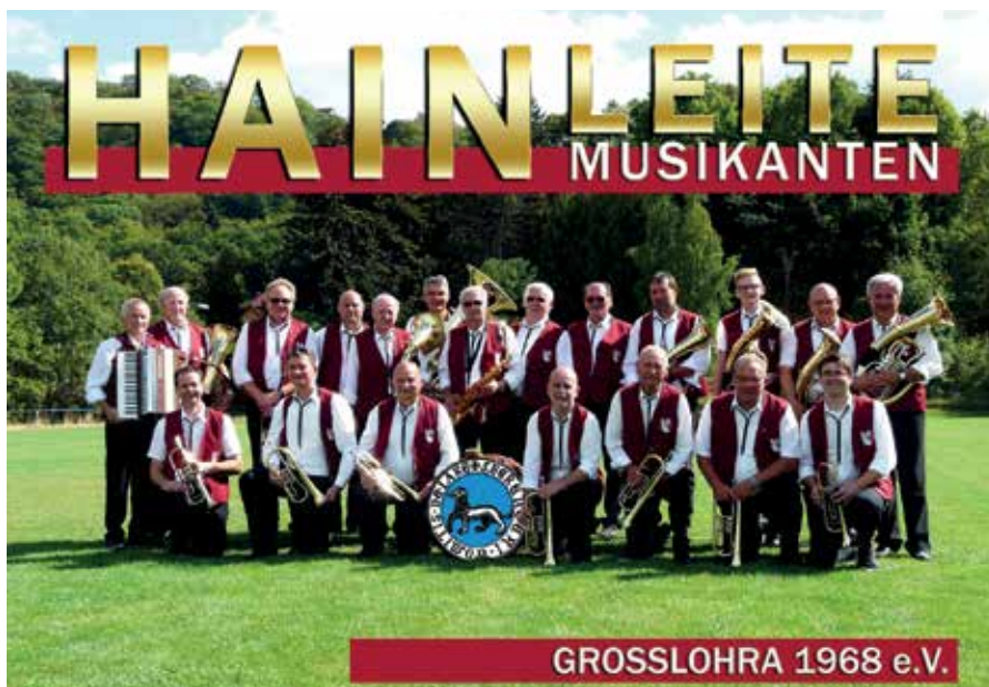
GROSSLOHRA 1968 e.V.

Das 47. Blasmusikfest in der Kulturanlage in Friedrichlohra fand 2019 bei strahlendem Sonnenschein und heißen Temperaturen statt. Hunderte Besucher nutzten jeden Schatten der Bäume an der Bühne aus und lauschten den Klängen der Orchester. Alle Musiker gaben ihr Bestes, was auch durch stürmischen Applaus der Zuschauer belohnt wurde. Alle Bläsergruppen freuen sich schon auf das 48. Blasmusikfest 2020 und bekundeten freudig ihre Zusage. Die Gemeinde unterstützte dieses Event mit ihren Möglichkeiten. Dank allen Helfern bei der Vor- und Nachbereitung ist uns dieses Fest wieder gelungen.