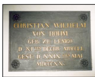
Gedenkplatte Christian Wilhelm von Dohm