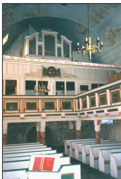
Knauf Orgel 1867