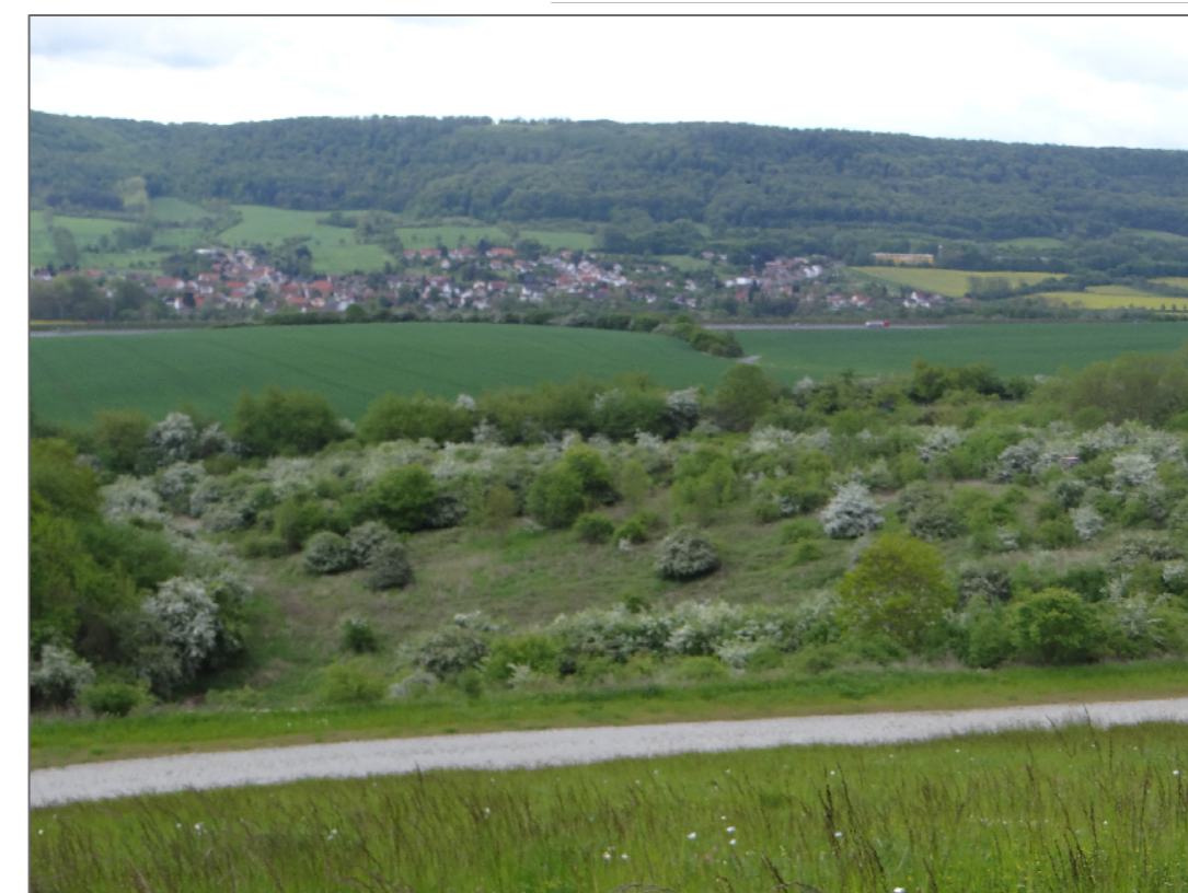
Halbtrockenrasengesellschaften mit beginnender Verbuschung im südlichen Standortbereich