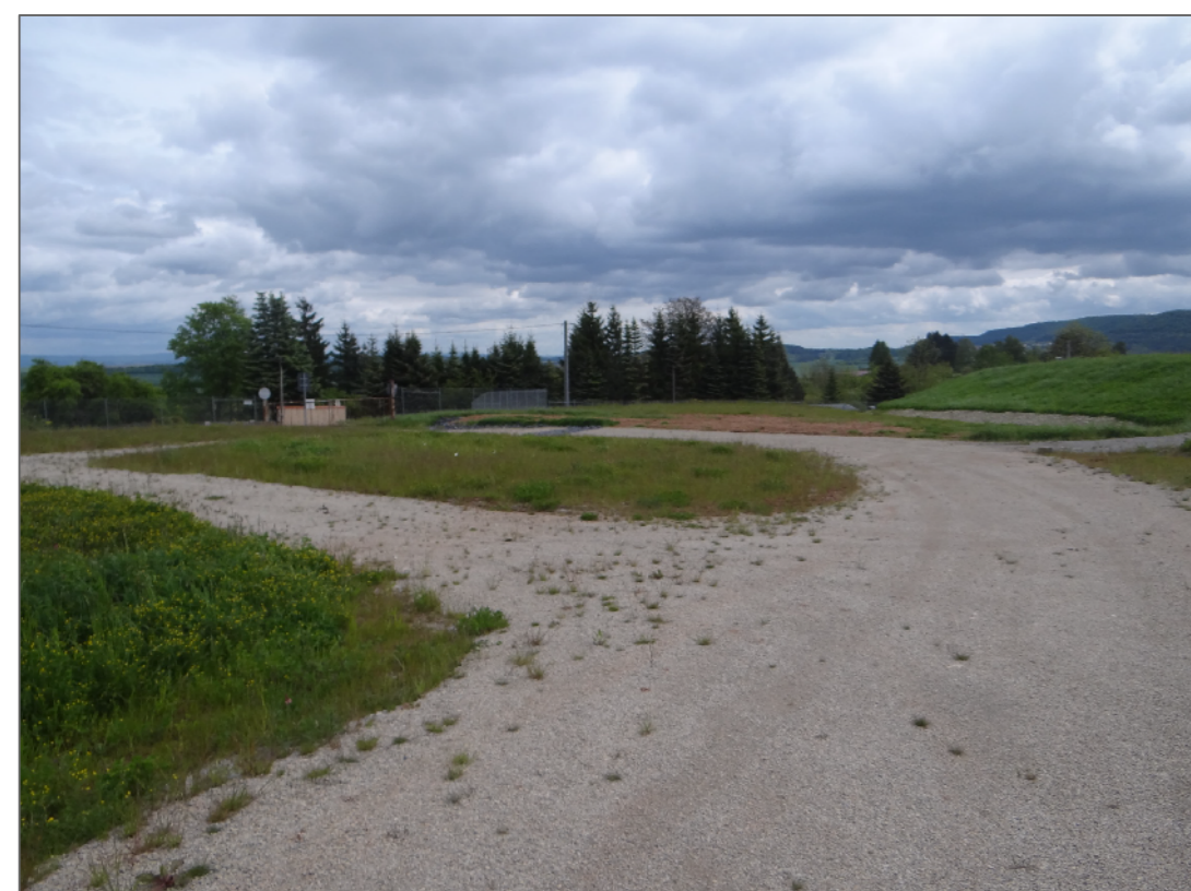
nördlicher Bereich des Plangebietes